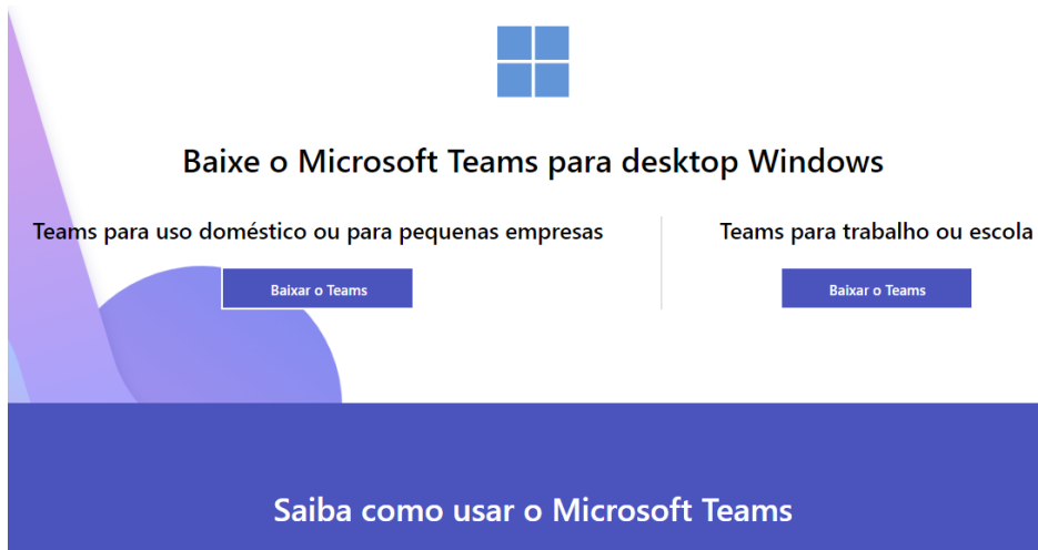
Figura 1. Página para baixar o Teams com antecedência.

https://www.microsoft.com/pt-br/microsoft-teams/download-app